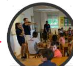
Orden y limpieza