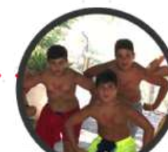
Trabajo en equipo