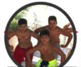
Trabajo en equipo