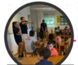
Orden y limpieza