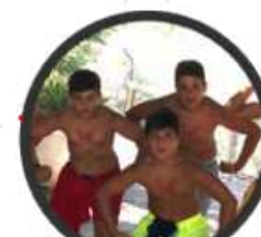
Trabajo en equipo