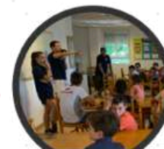
Orden y limpieza